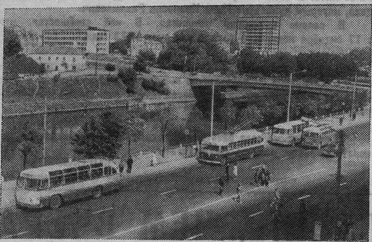
Столица Литовской ССР — Вильнюс. Улица Каролиса Пожело.