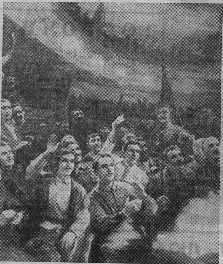
На десятом Всероссийском съезде Советов (1922 год) была принята резолюция об образовании СССР.

(Картина художника Ю. Е. Биноградова. Из экспозиции Центрального музея Революции СССР).