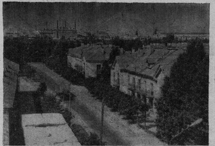
Улица Максима Горького.