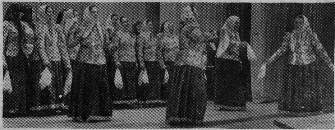
Заслуженной славой не только в нашем районе пользуется фольклорный хор деревни Монастырек. В его репертуаре старинные песни родного края. С большим задором и темпераментом исполняют их участницы коллектива. Хор выступал на многих смотрах и имеет немало различных наград. НА СНИМКЕ: хор деревни Монастырек.

Что касается вопросов, так сказать, сегодняшнего дня — о крупнейших водохранилищах и городах, созданных и построенных за годы Советской власти, то тут не было никаких границ. Наиболее ценными оказались ответы, в которых есть конкретные названия и суммарные цифровые данные.