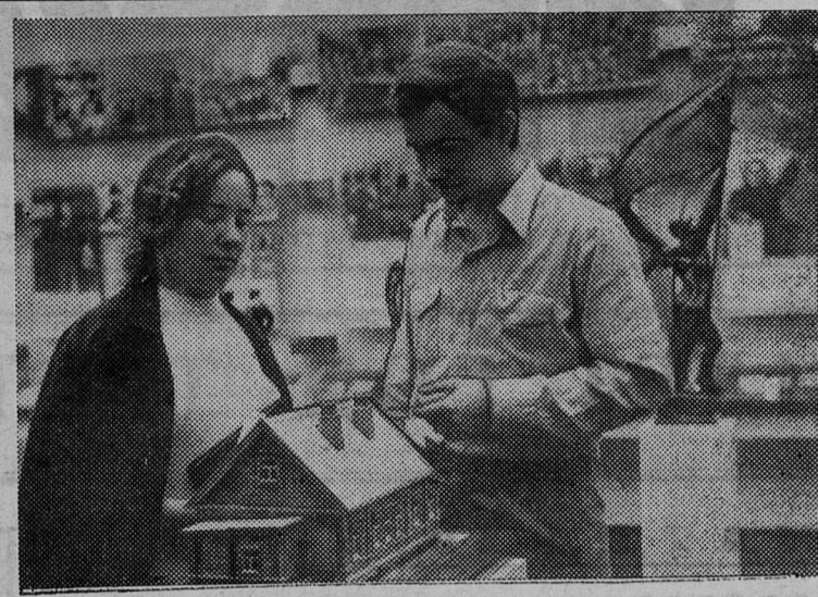
Москва. В Центральном музее В. И. Ленина открылась выставка «Коммунистическая партия Советского Союза — партия Ленина». Ее экспозиция посвящена 70-летию II съезда РСДРП. На снимке: макет дома в городе Пскове, где в ноябре 1902 года был образован Организационный Комитет по созыву II съезда РСДРП.