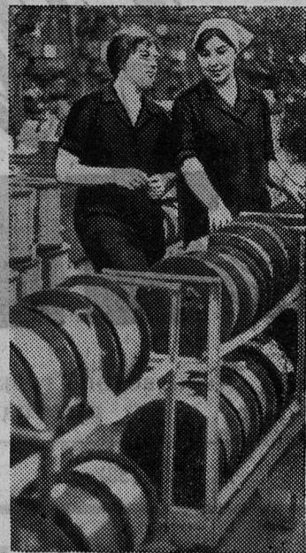
Успешно начал новый трудовой год коллектив Московского кабельного завода, продукция которого направляется во все республики Советского Союза и в 30 зарубежных стран.