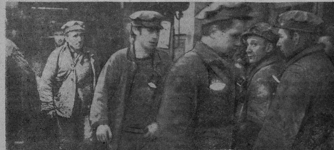
Шахта имени С. М. Кирова. СМЕНА ИДЕТ.