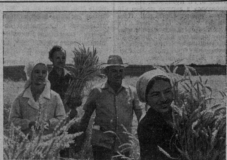
КУСТАНАЙСКАЯ ОБЛАСТЬ. Торжественен тот момент, когда первый скошенный колос падает к ногам хлебороба. Опытный глаз сразу видит — урожай выращен отменный. Теперь нужно вовремя и без потерь убрать его в закрома.

С боевым настроем, почти на месяц раньше обычного, начали в этом году уборку зерновых механизаторы Кустанайской области. Изменил обычные сроки клин озимой пшеницы, которая ныне впервые выращена на больших площадях.