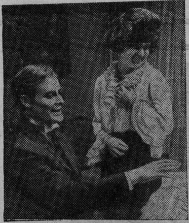
Москва. На киностудии «Мосфильм» снимается многосерийный телевизионный фильм «Хождение