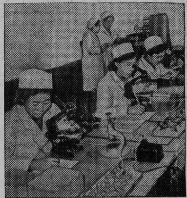
КНДР. Быстро развивающемуся народному хозяйству республики с каждым годом требуется все больше квалифицированных специалистов, владеющих передовыми знаниями.

В съезд Трудовой партии Кореи поставил задачу — подготовить за годы шестилетнего плана развития народного хозяйства большой отряд инженерно-технических работников.