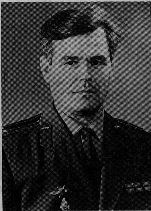
Командир космического корабля «Союз-12» Василий Григорьевич ЛАЗАРЕВ.