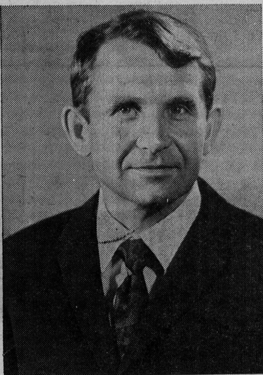
Бортинженер космического корабля «Союз-12» Олег Григорьевич МАКАРОВ.