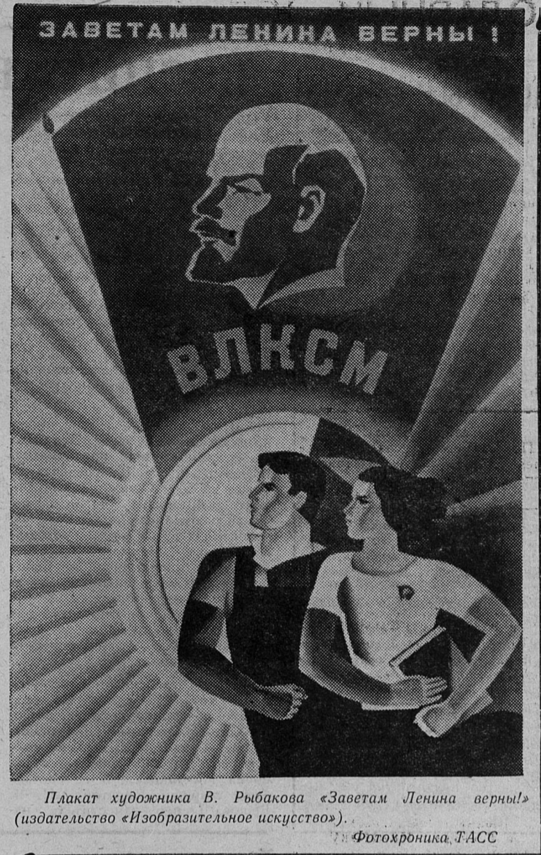
Плакат художника В. Рыбакова «Заветам Ленина верны!» (издательство «Изобразительное искусство»).

Помню, как комсомольцы шахты имени С. М. Кирова послали меня своим делегатом на окружную комсомольскую конференцию. Прибыли мы в Псков, перед Домом Советов — галерея портретов стахановцев. Среди них Геннадий Но-