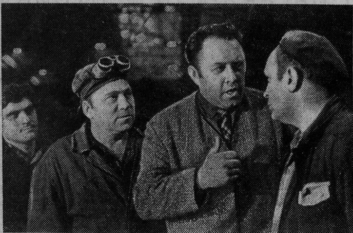
Партийная организация литейного цеха Московского электромашиностро-

секретарь парторганизации домоуправления № 1 ЖКО шахтоуправления «Ленинградсланец».