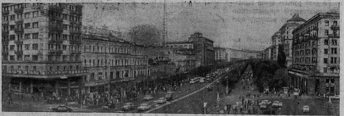
Киев сегодня. Крещатик.

А. МИХАЙЛОВ, председатель комитета по физкультуре и спорту.