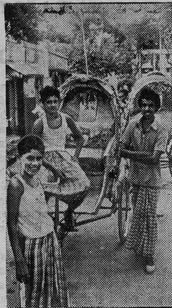
Велорикши пока еще основной вид транспорта в городах Народной Республики Бангладеш. НА СНИМКЕ: на улице Дакки. В ожидании пассажиров.

Г. БАБАЕВ, председатель ГК ДОСААФ, главный секретарь соревнований.