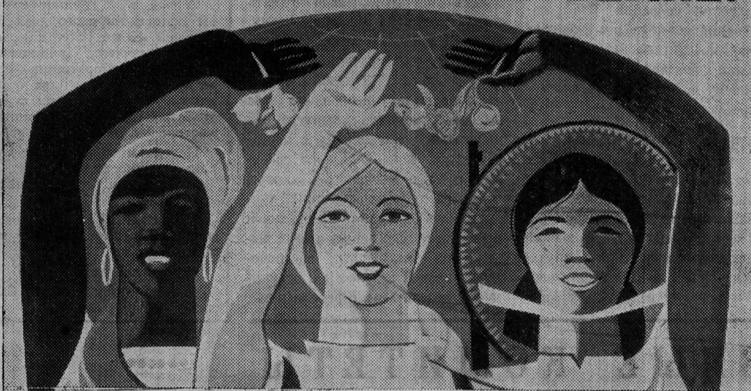
Плакаты художника Э. Арцруняна «За мир и счастье на земле!», выпущенный издательством «Изобразительное искусство» к Международному женскому дню.