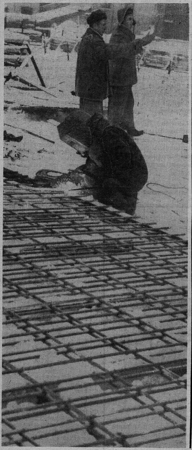
Сварка арматуры на строительстве аккумуляторных бункеров обогатительной фабрики.