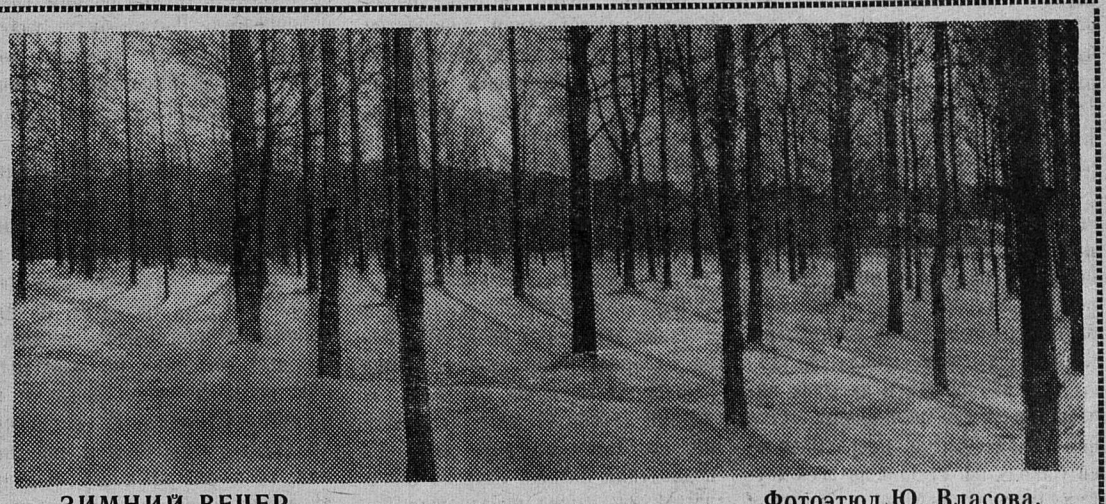
ЗИМНИЙ ВЕЧЕР. Фотоэтиюд Ю. Власова.

Отряд по сбору дикорастущих лекарственных трав при детском секторе Дворца культуры комби-