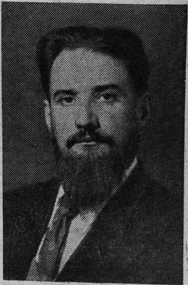
Сегодня исполняется 70 лет со дня рождения крупнейшего ученого-физика трижды Героя Социалистического Труда Игоря Васильевича Курчатова.

Курчатова принадлежит к числу крупнейших физиков, работающих в области использования внутриатомной энергии. Под научным руководством И. В. Курчатова и при его непосредственном участии в СССР создана атомная техника, развиты работы по управлению термоядерными реакциями. Игорь Васильевич — лауреат Ленинской и Государственной премий СССР.