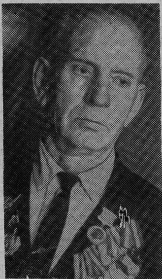
стрелковых соревнованиях частей и подразделений округа. Награжден двумя орденами Красного

Всю свою жизнь он посвятил труду и военной службе. 21 год стоял в боевом строю на страже наших границ с Японией. Командир противотанковой батареи, майор запаса, за высокие показатели в боевой и политической подготовке он неоднократно был отмечен боевыми правительственными наградами. Награжден орденом «Знак Почета» за то, что личный состав его противотанковой батареи занял первое место в