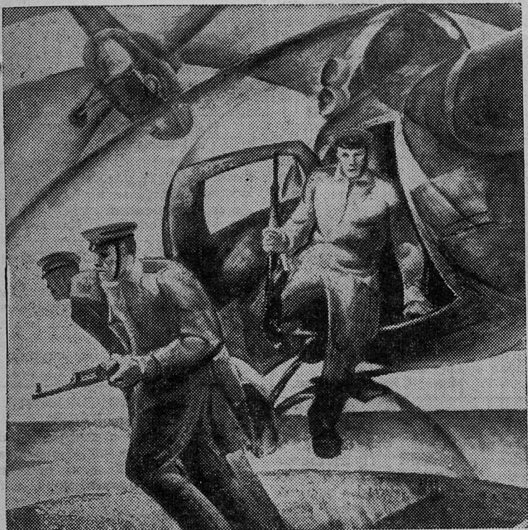
НА СНИМКЕ: картина «Тревожная группа». Автор Ю. И. Циркунов. (Рига).