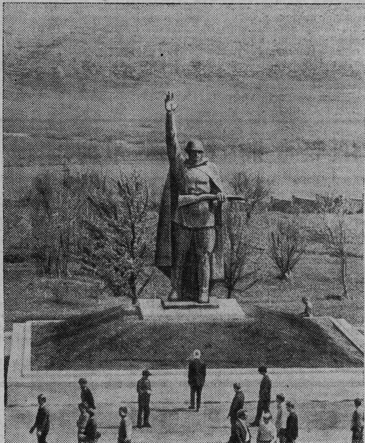
Монумент воина-победителя, установленный в Свободинском мемориале-музее Курской битвы.

Советское командование, своевременно определив кризис на-