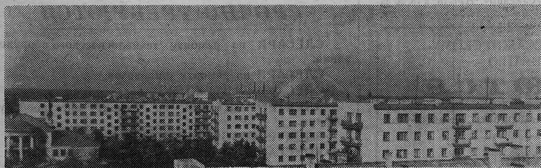
НАШ ГОРОД СЕГОДНЯ. Новый микрорайон.