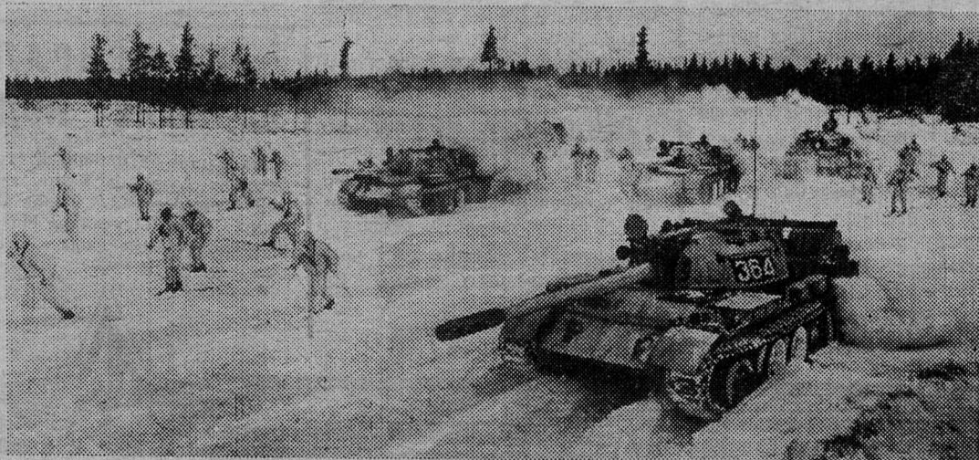
НА СНИМКЕ: при поддержке танков атакует пехота.