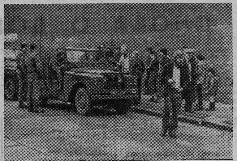
Обстановка в Ольстере продолжает накаляться. С каждым днем растет число людей, павших от пуль английских солдат и протестантских ультра.