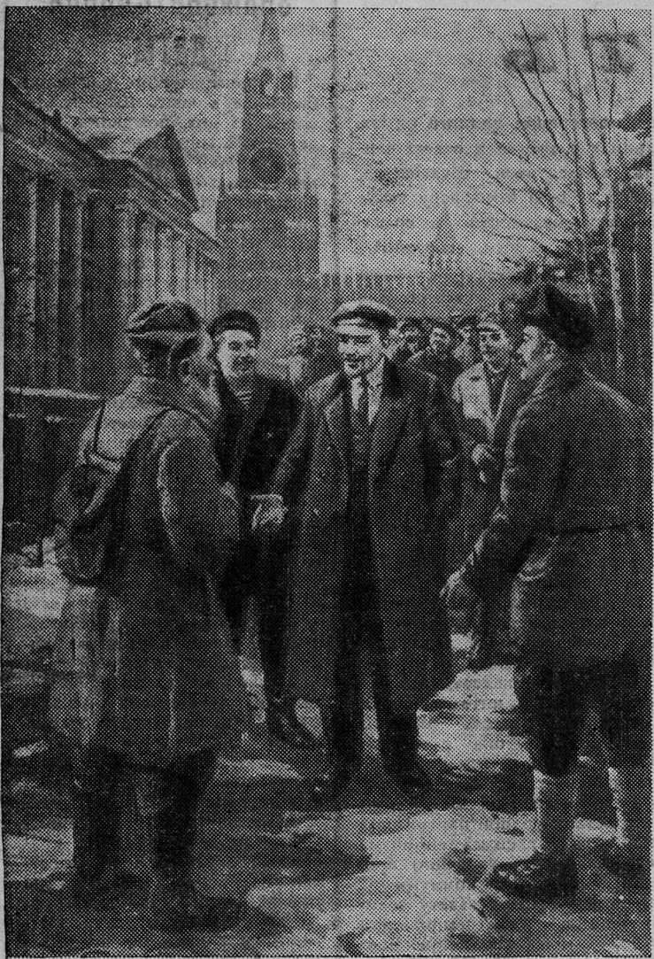
«Ходоки у В. И. Ленина». Картина художника Д. Налбандяна. 1967 год. (С выставки Центрального музея имени В. И. Ленина).