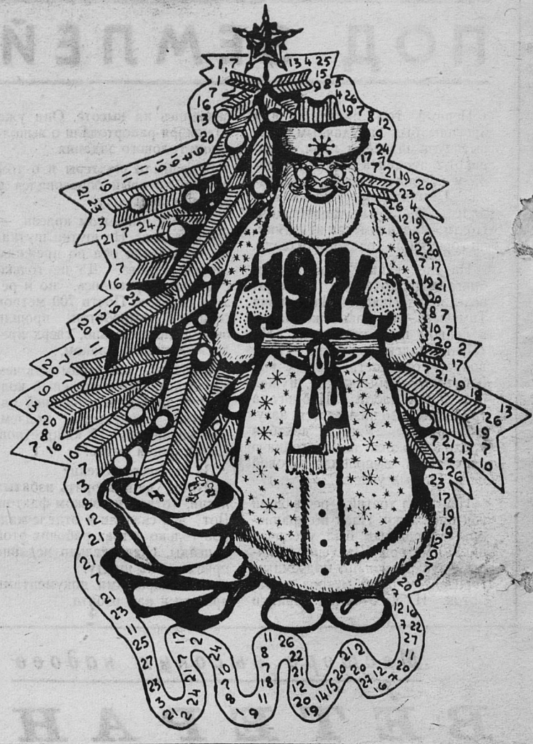
Следующий номер газеты выйдет 3 января 1974 года.

пляска вокруг елки. 4. 20, 7, 9, 7, 25, 22, 7 — русская народная сказка. 5. 22, 12, 5, 9 — погонщик оленей. 6. 1, 15, 9, 10, 12 — снежная вьюга. 7. 16, 2, 3, 11 — зимний вид спорта. 8. 13, 21, 17, 12, 9, 4 — зимний месяц. 9. 14, 15, 27, 12 — зимняя одежда. 10. 22, 12, 26, 7, 22 — ледяная площадка.