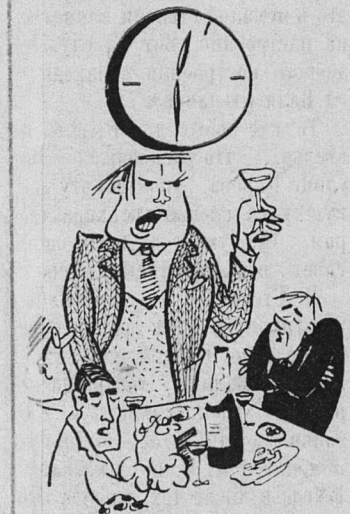
Проговорил. Рис. Я. ГОЛОФРИША.