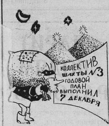
Сюда я уже опоздал.