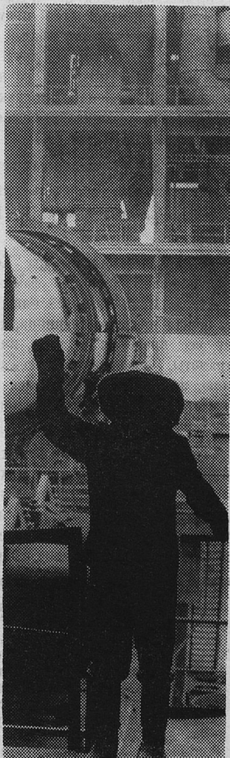
Цементный завод занимает в этом году одно из ведущих мест в социалистическом соревновании предприятий города за досрочное выполнение плана четвертого года пятилетки.

НА СНИМКЕ: в цехе обжига цементного завода.