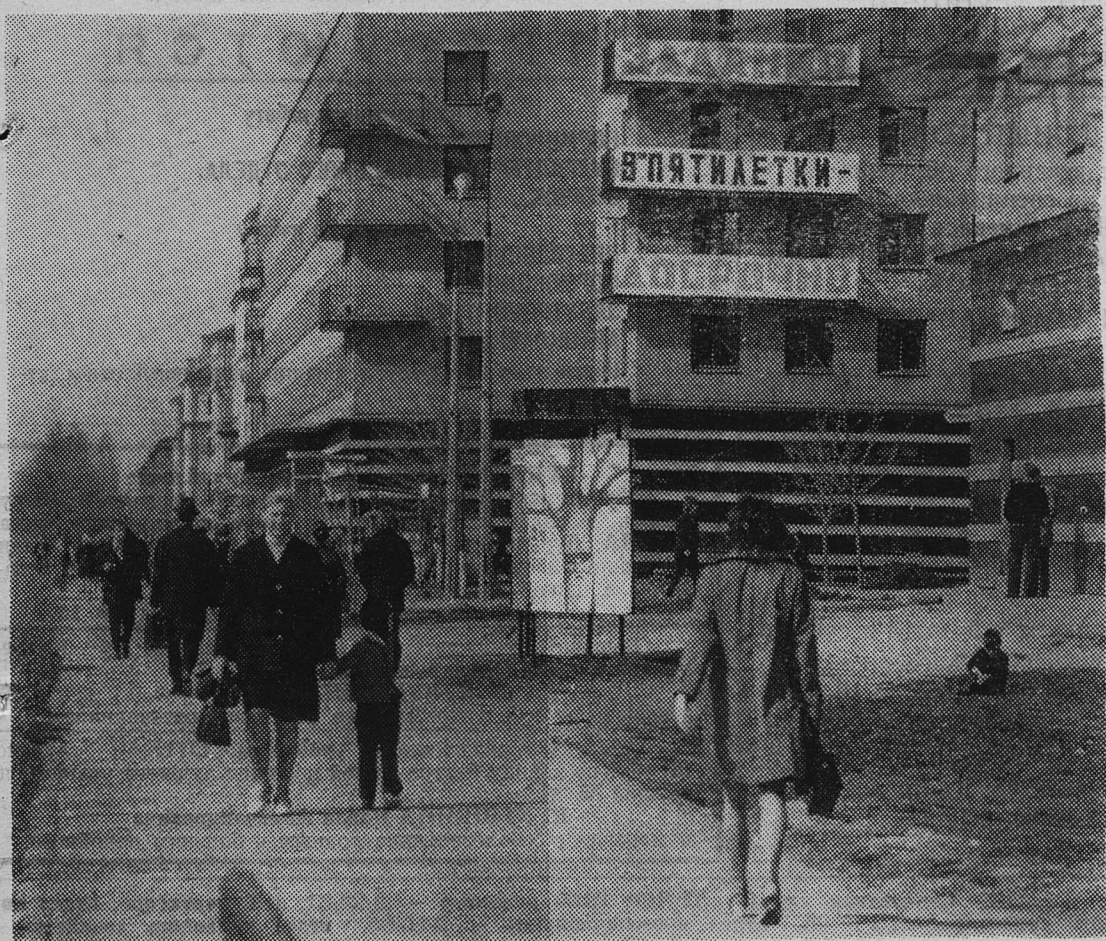
НАШ ГОРОД СЕГОДНЯ. Улица Кирова.