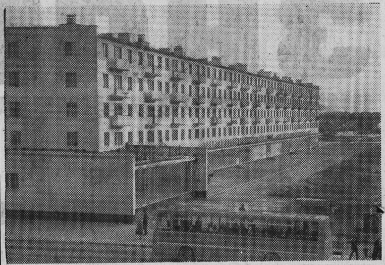
НАШ ГОРОД СЕГОДНЯ. Третий микрорайон.