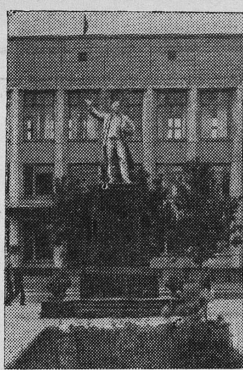
и установлен памятник В. И. Ленину.

За годы Советской власти Вешенская — районный центр Ростовской области — преобразилась, помолодела. Появились кварталы новых жилых домов, утопающих в зелени. Построены Дом Советов, Дворец культуры, универсам, гостиница и другие общественные здания. В быт станичников прочно вошли радио, электричество, водопровод, кино и телевидение. В центре станицы разбит парк