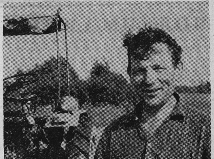
ПО СЛЕДАМ НАШИХ ВЫСТУПЛЕНИЙ