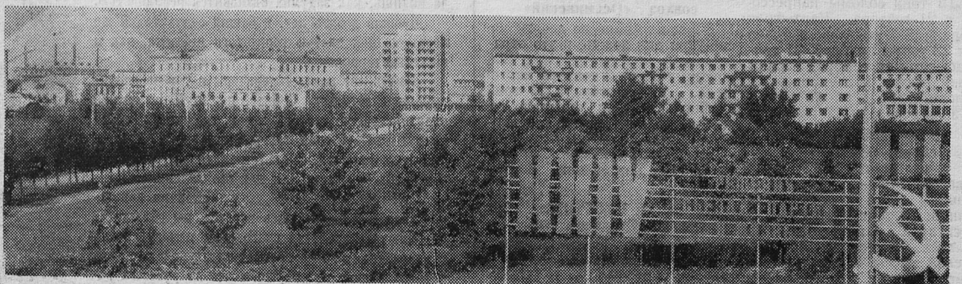
НАШ ГОРОД СЕГОДНЯ.