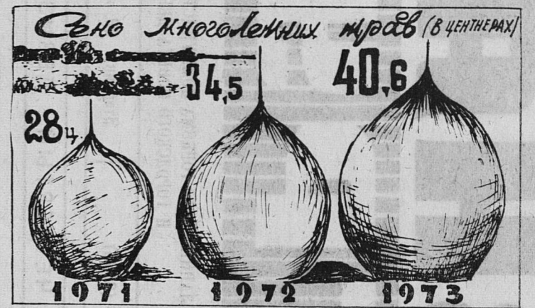
ДИАГРАММА № 3

совхозу влияние советов бригад заметно. Если, например, в 1972 году наблюдалось много прогулов и других нарушений трудовой дисциплины, то в 1973 они сократились втрое.