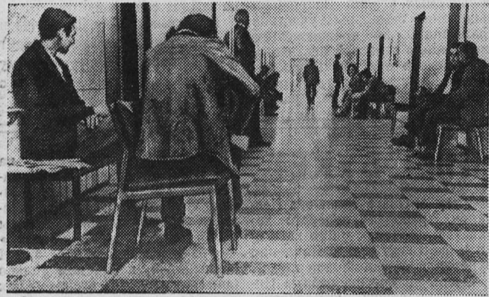
В Федеративной Республике Германии растет безработица. Общее количество полностью безработных превышает сейчас 527 тысяч человек. Только в августе работу потеряли более 36 тысяч западногерманских граждан.

Несмотря на то, что в этом учебном году мы проучились только один месяц, совет физкультуры провел значительную работу. Надолго останется в памяти учащихся осенний комсомольско-профсоюзный кросс,