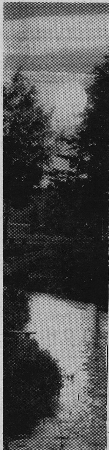
Падает на воду теплый свет заката. Темные деревья, скромная скамья... Но другой картины сердцу и не надо. Это край мой сланцевский, Родина моя!