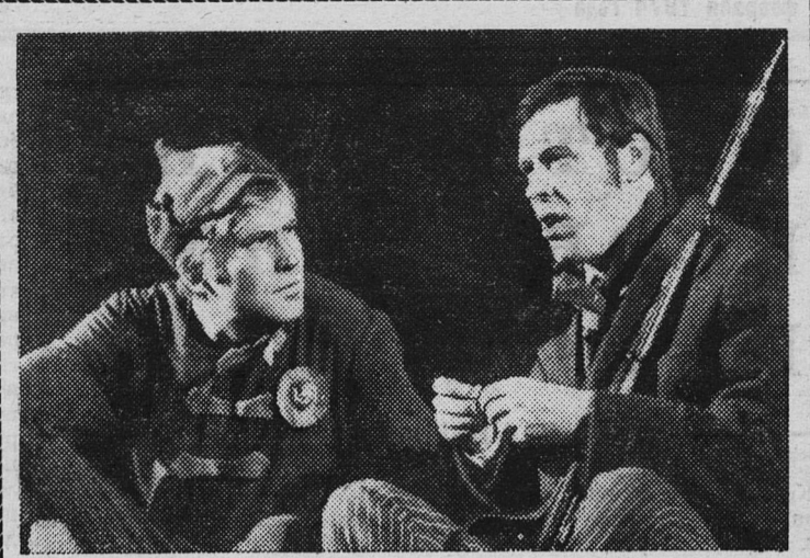
ПО РОМАНУ ГЛАДКОВА

В деревне Выскатка проходили соревнования на лично-командное первенство Сланцевского районного совета ДСО «Урожай» по лыжным гонкам и сдаче норм ГТО. Погода благоприятствовала спортсменам.