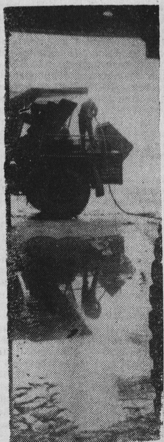
ПЕРЕД ВЫЕЗДОМ В РЕЙС.