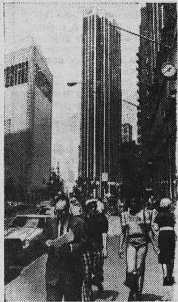
В Соединенных Штатах Америки 36 городов с численностью населения свыше миллиона человек. Крупнейший город страны — Нью-Йорк, в котором проживает около 8 миллионов жителей.

На снимке: площадь Колумба.