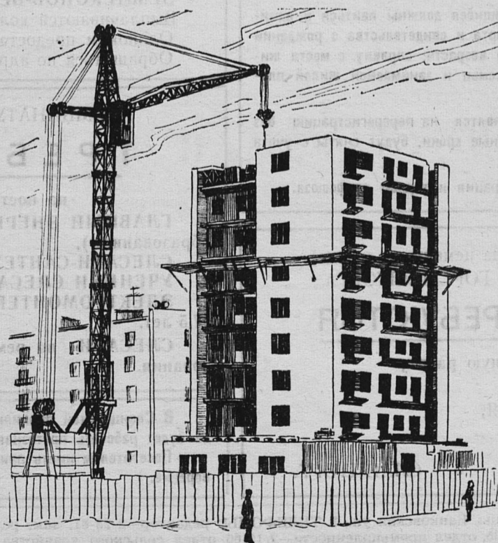
Страна все больше строит год от года. Растут заводы, города растут. Как журавли, на стройках краны ходят... И Сланцы тоже рвутся в высоту. Рисунок А. Михайлова.

Мы в пятом классе, подражая Пушкину, Писали сочинение унылое, Что любим осень, нашу осень русскую, Что скучный дождик в нас вселяет силу. А за окном весна бурлила бешено, А за окном ручьи галдят галчатами. Нам было просто по-щенячьему весело, И от весны мы были конопатыми. Прости же, Пушкин, этот звон малиновый. Он даже камень разбудить способен. Не скоро осень, грустная и длинная... Стоит весна на солнечном пороге.