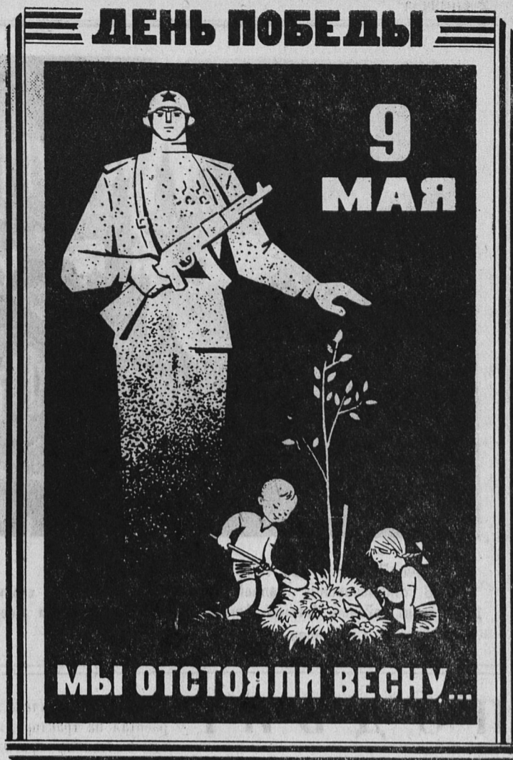
Рисунок художника И. БРодовского.