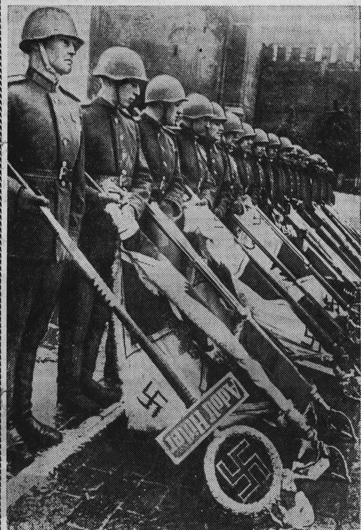
МОСКВА. Парад Победы. Эти гитлеровские знамена будут брошены к подножию Мавзолея.

Н. ТЕРЕНТЬЕВ, председатель совета ветеранов войны.