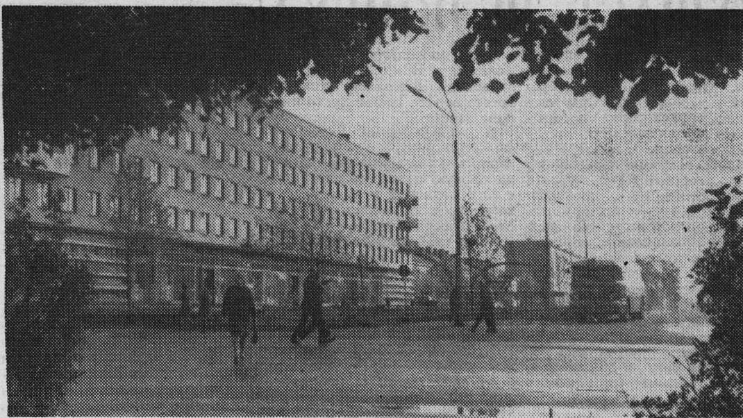
НАШ ГОРОД СЕГОДНЯ. УЛИЦА ЛЕНИНА.

Т. СУСЛОВА, редактор стенгазеты «Заводская неделя».