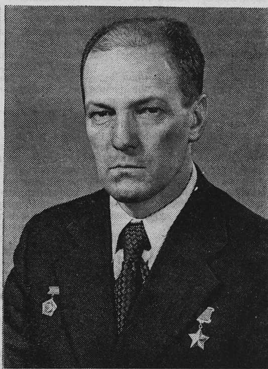
Бортинженер космического корабля «Союз-16»

Анатолий Васильевич ФИЛИПЧЕНКО, летчик-космонавт СССР, Герой Советского Союза.