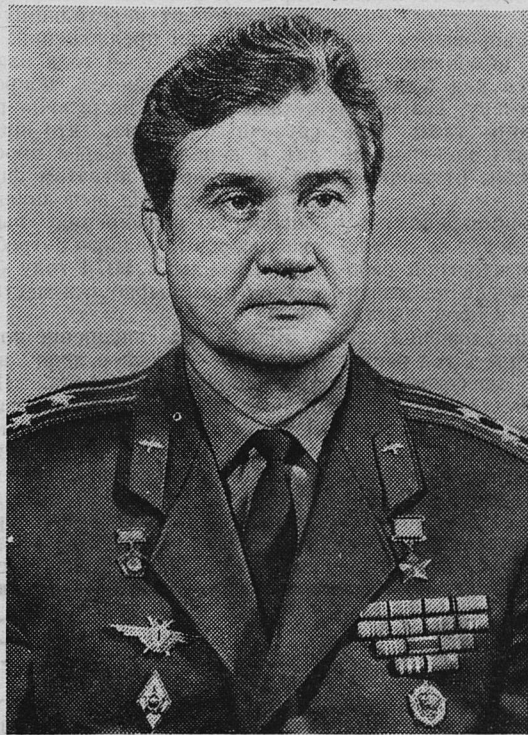
Командир космического корабля «Союз-16» полковник

Анатолий Васильевич ФИЛИПЧЕНКО, летчик-космонавт СССР, Герой Советского Союза.