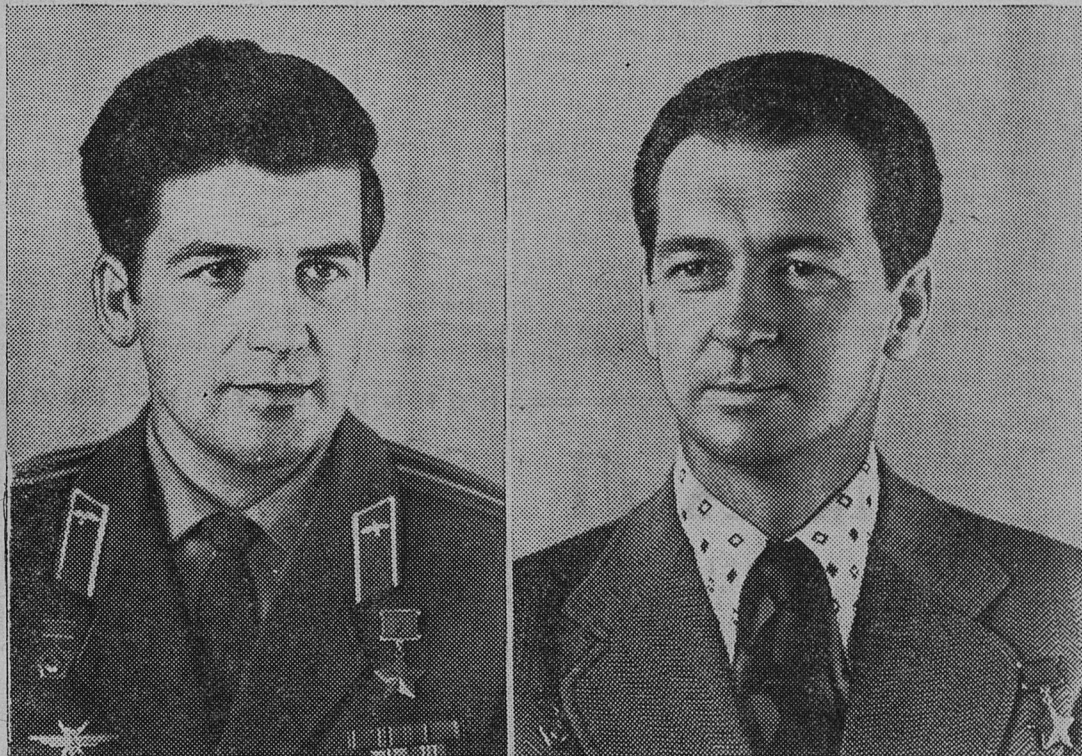
Командир космического корабля «Союз-18» летчик-космонавт СССР, Герой Советского Союза Петр Ильич КЛИМУК.