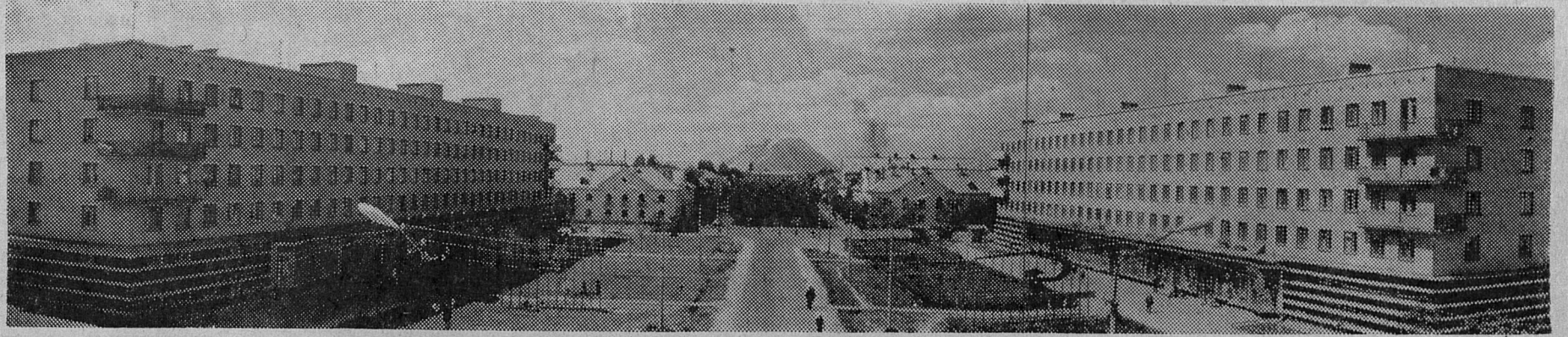
НАШ ГОРОД. Улица Ленина.