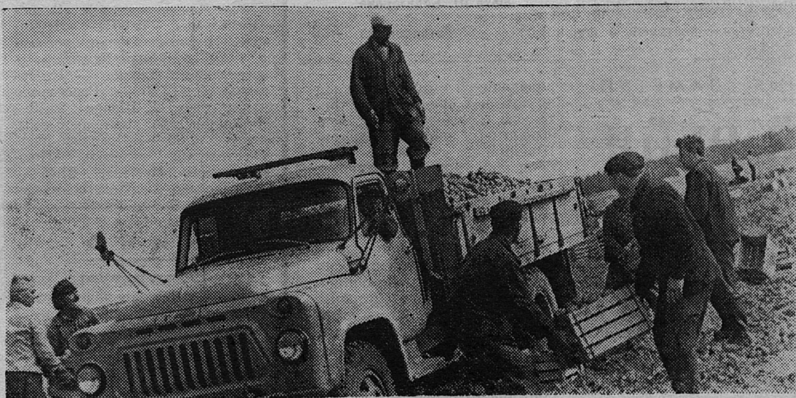
вы видите, как шефы совхоза «Родина» — труженики комбината «Сланцы» работают на уборке картофеля на совхозных полях. Их помощь также способствовала тому, что в хозяйстве уборка картофеля уже завершена.