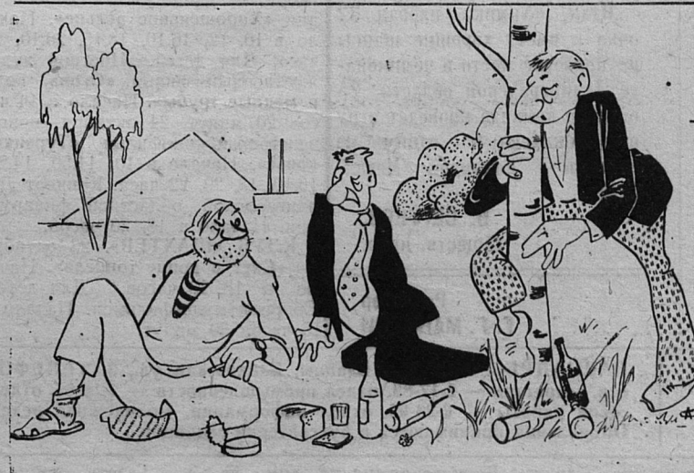
Рис. С. Анисимова.