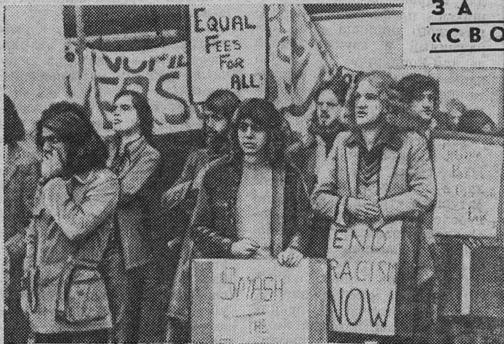
Студенты Англии выступают против расовой дискриминации в вузах страны. НА СНИМКЕ: пикет студентов Манчестера, требующих равенства для всех учащихся.