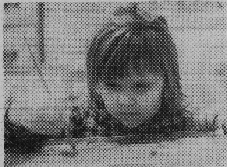
Я достаю краски И рисую сказки. Синим — море нарисую,

В лесу, в берлоге под густою елью Медведь-трудяга преспокойно жил. Но волк пришел, нечаянно иль с целью, Среди зимы медведя разбудил. В руке магнитофон, в другой — гитара (И по последней моде в брюках-клеш), Медведю заявил: «Молчи-ка, старый! Ты мне повеселиться не даешь. Эй, Лисонька-Лиса, подруга, где ты? Да за тебя я жизнь отдать готов! Во всем лесу тебя милее нету, Ты так прекрасна, не найти и слов...» Из-за кустов лисица, в полной форме Приветствие короткое: «Хэлло!», Она в таких же брюках, на «платформе», Сигара и прическа-«помело». Вздыхнул медведь, увидев чудо это, Успел промолвить: «Ну и молодежь!» Тут серый подскокил: «Но-но, маэстро!» И процедил сквозь зубы: «В морду хошь? Тебе-то что за дело, за забота? Ведь жизнь — она, как птичка, пролетит. О чем ты говоришь?» Ах, да! Работа. Не волк работа, в лес не уберит. Ты отстаешь от жизни, косолапый, И нас укладом старым не пили, Меня пока что кормят мама с папой И скоро мне подарят «Жигули». И — «чао» — удалились молодцы. Медведь затылок лапой почесал... Неслись из чащи песни «удалые» Про то, как мишка серость показал.