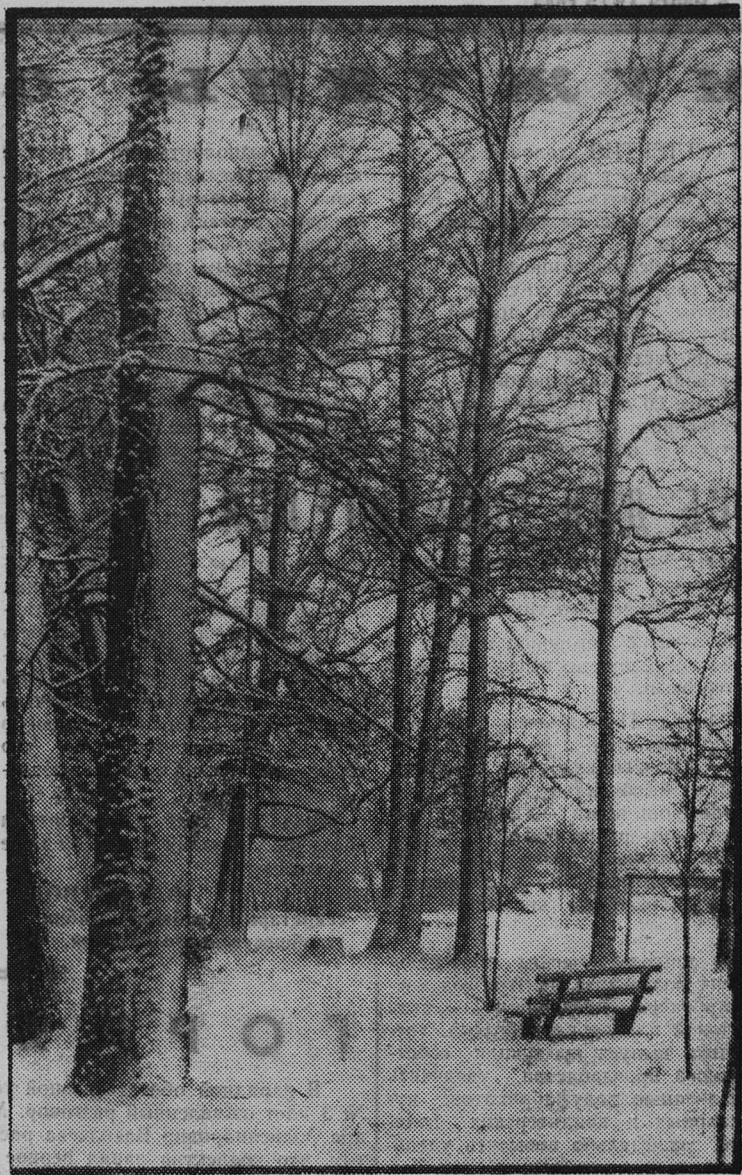
ВОСПОМИНАНИЯ О ЗИМЕ.