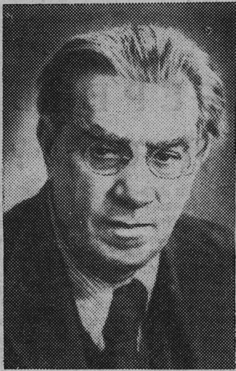
Р. М. ГЛИЗЕР

11 января исполняется 100 лет со дня рождения композитора, общественного деятеля и педагога Рейнольда Мориевича Глизера (1875—1956).