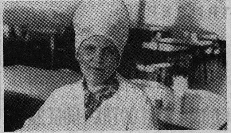
Переходящее Красное знамя комбината общественного питания за первый квартал присуждено коллективу столовой № 4.