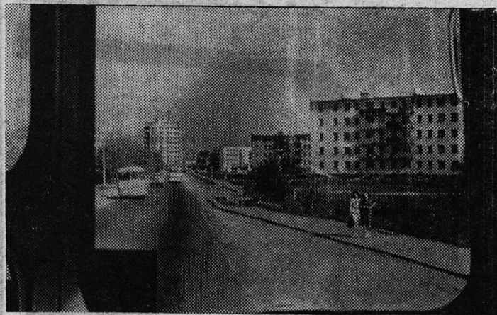
НАШ ГОРОД. К центру Сланцев.