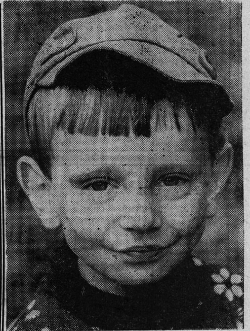
Парень с характером.